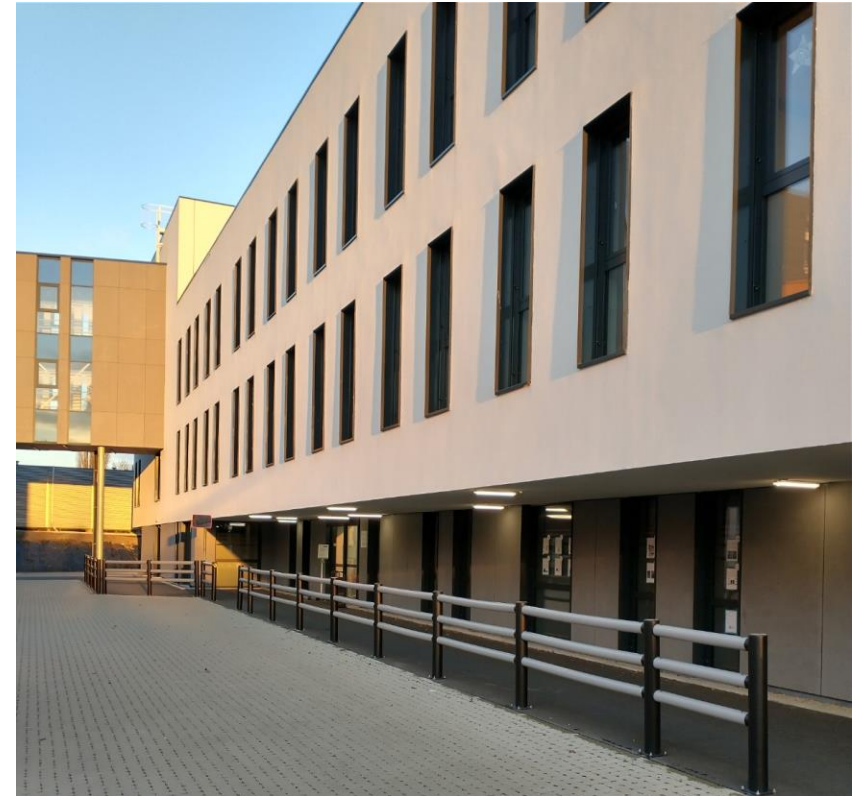
Construction d'un nouveau bâtiment (Z) – Dialyse, Oncologie, Gériatrie, Réhabilitation