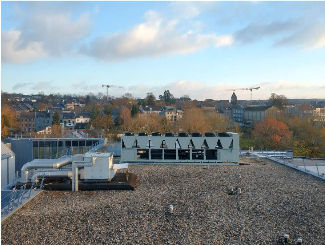
Nouvelle production de froid centralisée – 800 kW